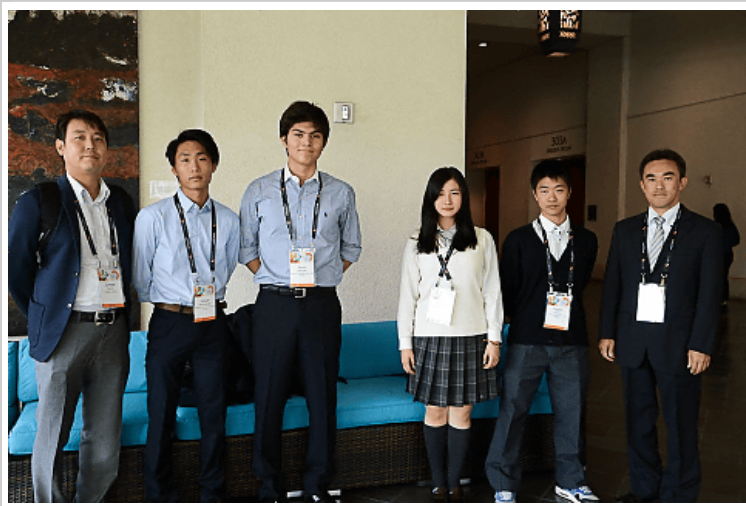
日本から参加した東京・早稲田大学高等学院（左）と北海道・立命館慶祥中学校・高等学校（右）の皆さん