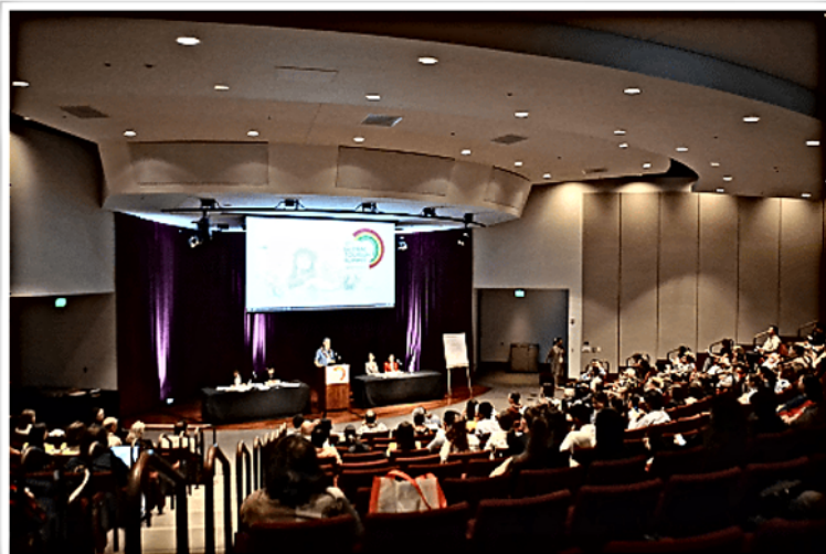
ハワイ州観光局は、グローバル・スチューデント・ディベートを開催。写真はファイナルの様子

9月19日～21日（現地時間）に米国ハワイ・オアフ島で開催された「グローバル・ツーリズム・サミット」。このサミットは観光業界関係者向けに年1回開催される総会だが、この総会の一環として、ハワイ州観光局主催の「グローバル・スチューデント・ディベート（Global Student Debate）」が開催された。