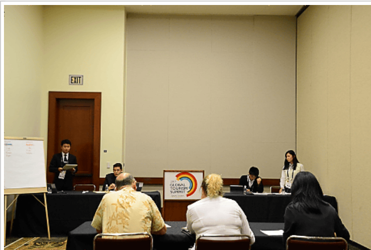
ディベートの様子。審査員3名のほかに誰でも自由に討論を聞くことができる公開討論形式で行なわれた

今回のディベートのテーマは「観光事業は文化保護を援助（支援）するのか」。各チームで肯定側と否定側に分かれてディベートが行なわれた。